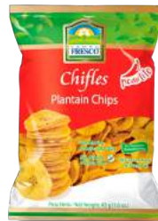
Chifles picantes redondos Sin Gluten 0g de Grasas Trans Presentación: 45 g