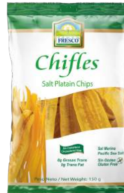
Chifles Largos de sal Sin Gluten 0g de Grasas Trans Presentación: 150 g