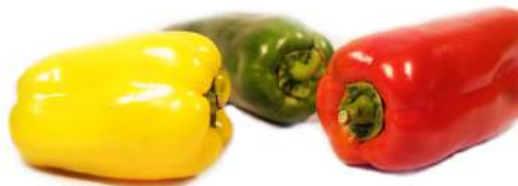
Pimientos Verde Rojo-Amarillo