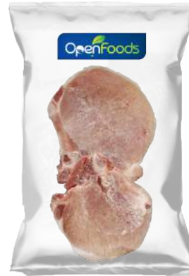
Chuletas de Cerdo