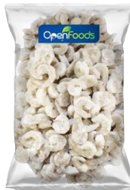
Camarones Congelados IQF