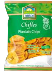
Chifles sabor a limón redondos Sin Gluten 0g de Grasas Trans Presentación: 45 g