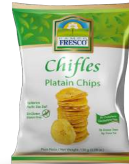
Chifles de sal redondos Sin Gluten 0g de Grasas Trans Presentación: 150 g