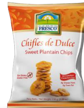
Chifles de Dulce Sin Gluten 0g de Grasas Trans Presentación: 150 g