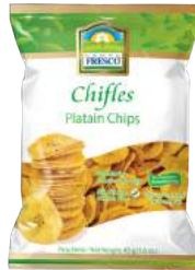
Chifles de sal redondos Sin Gluten 0g de Grasas Trans Presentación: 45 g